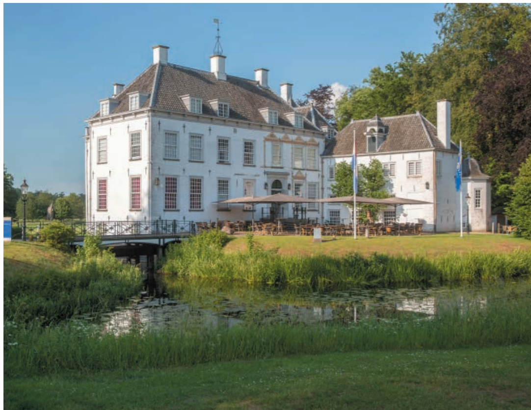
DEELNEMERS AAN LEERPROGRAMMA 'MET HET OOG OP DE TOEKOMST'